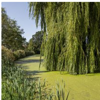
Image does not exist: /var/www/vhosts/vanzonmakelaars.cdn-tmo.nl/httpdocs/Files/woningen/5306300/36642026.pdf