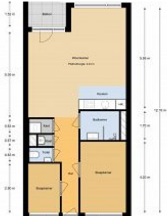
Image does not exist: /var/www/vhosts/vanzonmakelaars.cdn-tno.nl/httpdocs/files/woningen/5160730/92816463.pdf