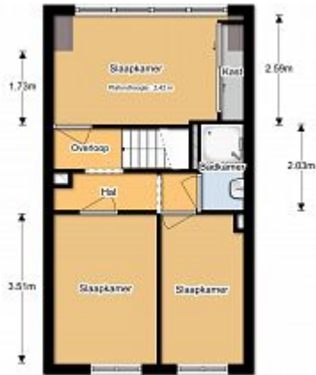
Image does not exist: /var/www/hosts/vanzonmakelaars.cdn-tno.nl/httpdocs/Files/woningen/4689159/80468876.pdf

Neem contact op met ons voor een bezichtiging.