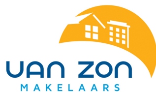
Image does not exist: /var/www/hosts/vanzonmakelaars.cdn-tno.nl/httpdocs/files/woningen/4352629/72674682.pdf

Neem contact op met ons voor een bezichtiging.